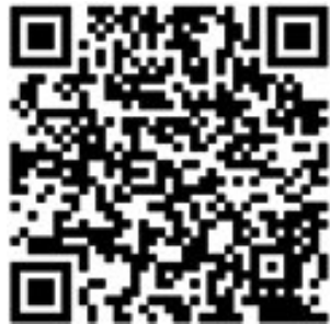
“克拉玛依日报”二维码

据了解,克拉玛依日报社已建成强势地位的主流媒体集群,除“克拉玛依日报”微信公众号外,还拥有《克拉玛依日报》、克拉玛依网、“嗨克拉玛依”客户端,齐全的新媒体阵容、专业的媒体团队,使克拉玛依日报社媒体集群在本地区乃至区域内具有强大的传播力,为克拉玛依的政治、经济、文化各领域的发展起到了舆论先锋引导作用,为人民生活提供了更多便利服务和了解信息的渠道。