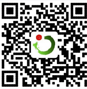
“嗨克拉玛依”二维码