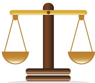
本版内容据新华网

从内部来说,法院坚决惩治司法腐败,坚持反腐败无禁区、全覆盖、零容忍,最高人民法院查处本院违纪违法干警53人,各级法院查处利用审判执行权违纪违法干警3338人,其中移送司法机关处理531人。